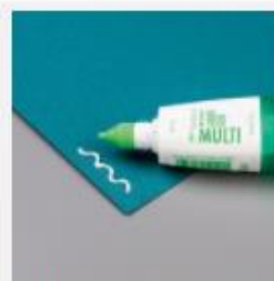
Multipurpose Liquid Glue [154974] € 8,00