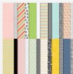
Pattern Party 12" X 12" (30.5 X 30.5 Cm) Host Designer Series Paper [155426] € 22,00