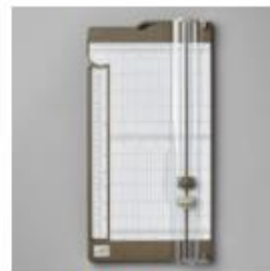
Paper Trimmer [152392] € 30,00