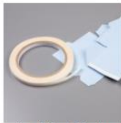
Tear & Tape Adhesive [158995] € 8,50