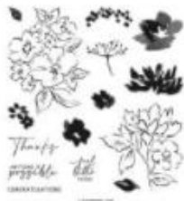
Hand Penned Petals Photopolymer Stamp Set [155070] € 27,00