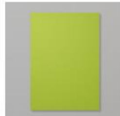
Granny Apple Green A4 Cardstock [147014] € 10,50