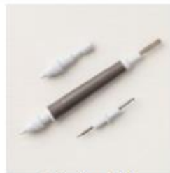
Take Your Pick [144107] € 12,00