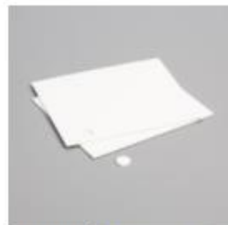
Stampin' Dimensionals [104430] € 5,00