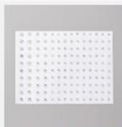
Rhinstone Basic Jewels [144220] € 8,00