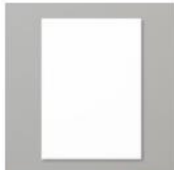
Basic White A4 Cardstock [159228] € 11,75