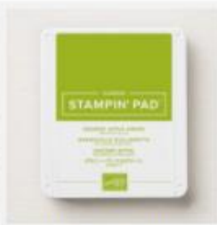
Granny Apple Green Stampin' Pad [147095] € 9,00