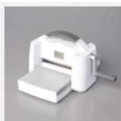
Stampin' Cut & Emboss Machine [149653] € 145,00