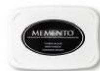
Tuxedo Black Memento Ink Pad [132708] € 7,50