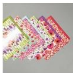
Peaceful Poppies Designer Series Paper [151324] € 14,00