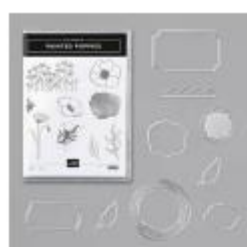
Painted Poppies Bundle [153827] € 83,00