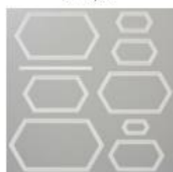
Stitched Nested Labels Dies [149658] € 42,00