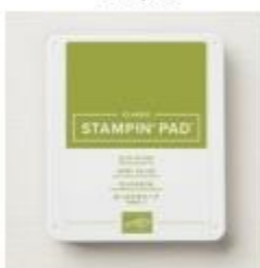
Old Olive Classic Stampin' Pad [147090] € 9,00