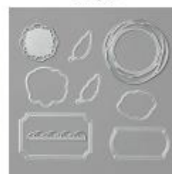
Painted Labels Dies [151605] € 42,00