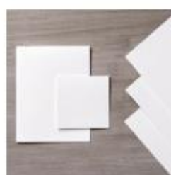
Whisper White A4 Thick Cardstock [140490] € 10,00