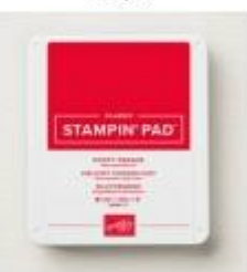
Poppy Parade Classic Stampin' Pad [147050] € 9,00