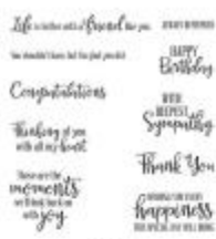
Peaceful Moments Cling Stamp Set (English) [151595] € 25,00