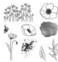
Painted Poppies Cling Stamp Set [151599] € 28,00